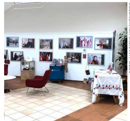
Fotoutställningen "Styrka i motvind" har visats på Landskrona stadsbibliotek.