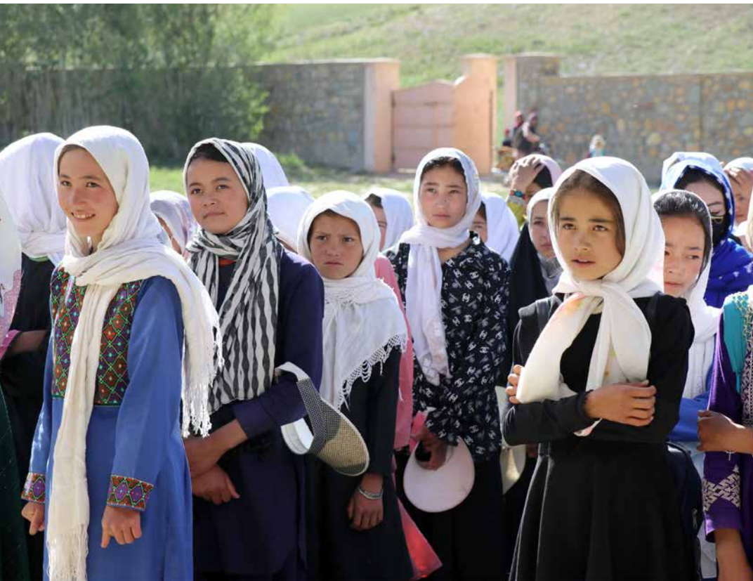
Flickorna i byn Sabzdara i Bamiyan väntar på att dagens skola ska börja.