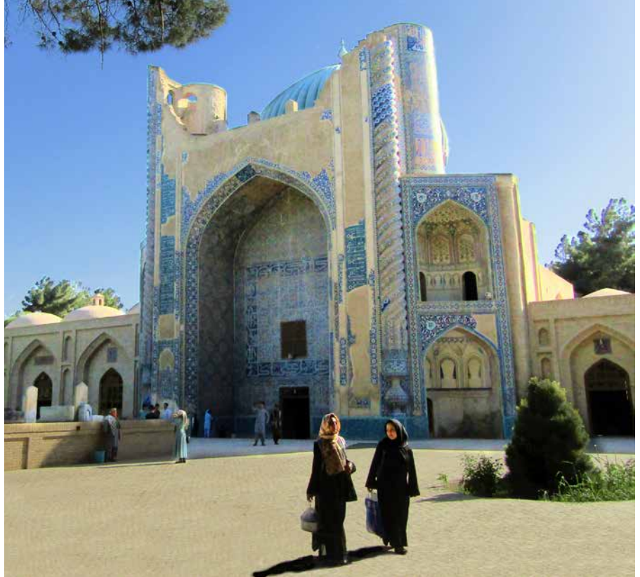
Gröna moskén i Balkh.