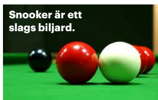
Snooker är ett slags biljard.

KLIMAT Eftersom Afghanistans styre inte är erkänt var Afghanistan inte inkluderat i klimatkonferensen COP30 i Brasilien. Talibanstyret sade att detta strider mot principer om klimaträttvisa. Ett fåtal representanter för Afghanistans civilsamhälle deltog i sidoaktiviteter.