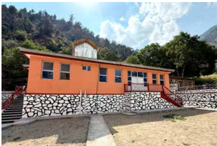
Den nya byggnaden för sjukvårdsmottagningen i Kolaam.