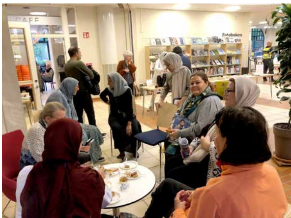
Est 30-tal personer kom på vernissage i Landskrona.