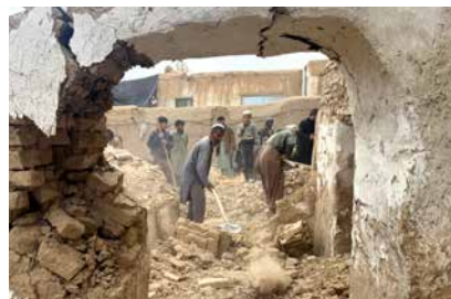
Boende i Khulmområdet, som var epicentrum för jordbävningen, röjer bland spillrorna.

Jordbävningen har också orsakat vissa skador på den historiska Blå moskén i Mazar-e Sharif. Bilder visar hur bråte från byggnaden har fallit till marken.