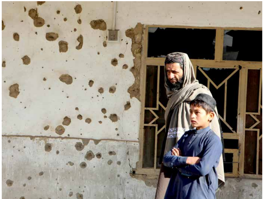
Personer i Spin Boldak i Afghanistan vid ett hus som skadats i striderna vid gränsen. Striderna ägde rum den 7 november, trots eldupphör och samtal mellan Pakistan och Afghanistan i Turkiet. Flera civila dödades denna dag.

Han menar att samtalen mellan Afghanistan och Pakistan är dödfödda. Enligt