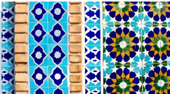
Kakelplattor på Blå moskén.