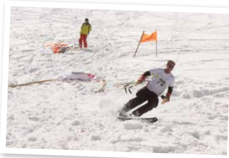
Lokala skidklubbar ordnar skidåkning i Bamiyan.

– Vi vinnlägger oss om att möta kvinnor i miljöer som är säkra för dem och på ett sätt som respekterar deras kultur. En av höjdpunkterna är marknaden Rabia