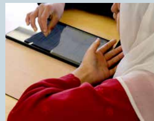
Läsplatta är ett av hjälpmedlen som eleverna har tillgång till.

EdTech genomförs i provinserna Kunduz, Baghlan, Nangarhar, Laghman och Bamiyan.