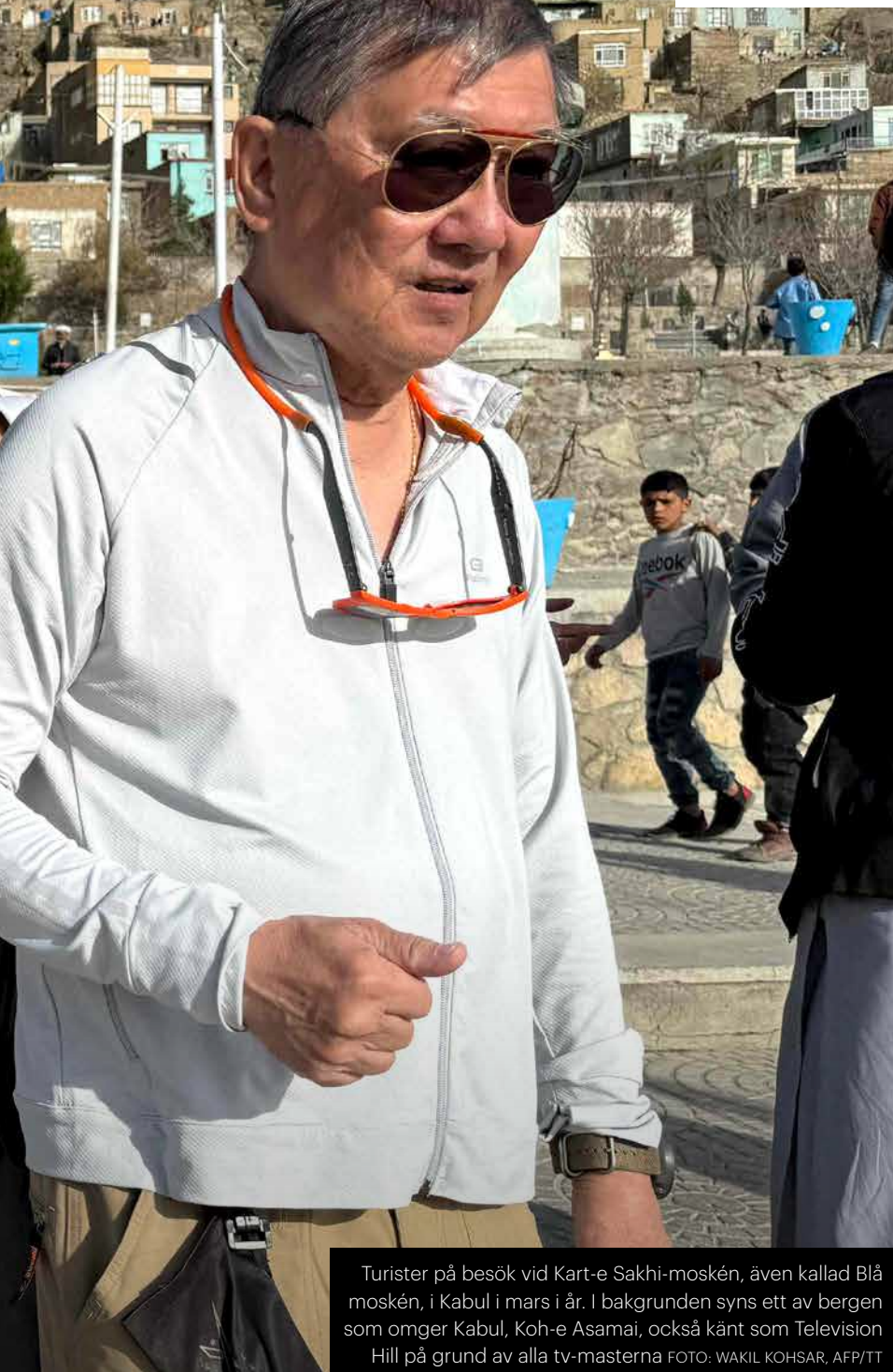
Turister på besök vid Kart-e Sakhi-moskén, även kallad Blå moskén, i Kabul i mars i år. I bakgrunden syns ett av bergen som omger Kabul, Koh-e Asamai, också känt som Television Hill på grund av alla tv-masterna

TEXT GÖRREL ESPELUND , FRILANSJOURNALIST