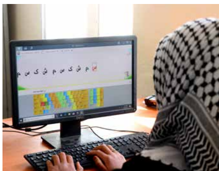
I projektet ingår också arbete med datorer.

döttrar. Just nu fortsätter skolan bara till årskurs sex. Flera årskullar har missat sin utbildning. Men vi fortsätter hoppas att våra barn ska kunna fortsätta sin utbildning, gå på universitetet och förverkliga