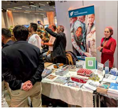
SAKs lokalförening i Uppsala deltog.