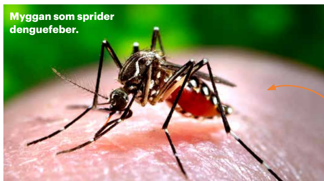
Myggan som sprider denguefeber.

HÄLSA Boende i Kabul är oroliga över att luftföroreningarna har ökat, redan i november. På grund av fattigdom eldar människor med olämpliga material.