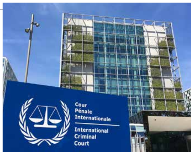
Internationella brottmålsdomstolen i Haag.