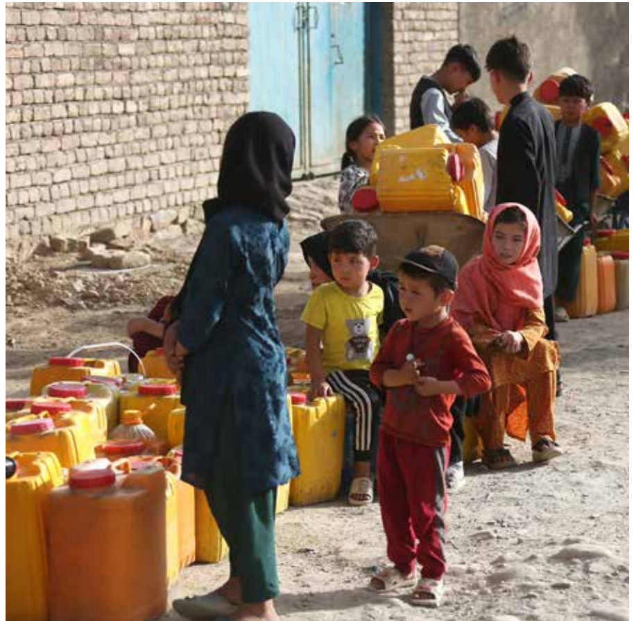
Barn i Kabul hämtar vatten vid en kommunal kran som är kopplad till en 300 meter djup brunn.

MERCY CORPS rapport lyfter flera orsaker till den accelererande vattenkrisen. Både före och efter maktskiftet 2021 har de afghanska regeringarna misslyckats med att bygga upp en fungerande infrastruktur. Trots 20 år med bistånd är Kabuls vatteninfrastruktur ”bedrövligt underutrustad”. Decennier av oreglerad vattenborrning har lett till överutnyttjande och förorening av Kabuls grundvatten, samtidigt som vik-