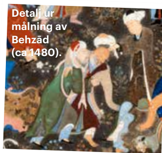
Detalj ur målning av Behzād (ca 1480).

HÄLSA WHO uttryckte i juli oro över pågående spridning av polio i södra Afghanistan. Världshälsoorganisationen varnar för att regionen fortsät-