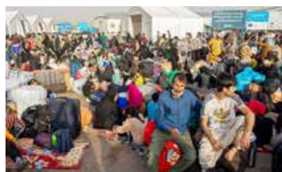
Afghaner som återvänt från Iran, nästan helt tomhända.

Kvinnor och barn står inför de största riskerna, uppger FN.