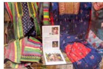
SAKs monter på utställningen.