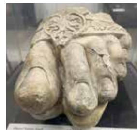
Foten från en marmorstaty från det grek-baktriska riket.