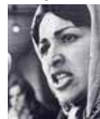
Meena Keshwar Kamal.

En av de första rättighetsbaserade organisationerna var Rawa (Revolutionary Association of the Women of Afghanistan) som grundades 1977 av Meena Keshwar