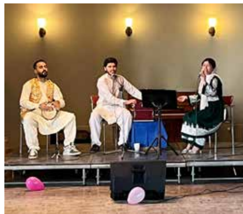
SAKs lokalförening i GÖTEBORG anordnade en afghansk afton med musik och mat.