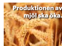
Produktionen av mjöl ska öka.

LIVSMEDEL Afghanistans produktion av vetemjöl motsvarar 60 procent av behovet i landet. Omkring 6 miljoner ton mjöl konsumeras varje år. 3,5 miljoner ton produceras i Afghanistan. Enligt de facto-styret pågår en satsning på att stimulera inhemsk produktion.