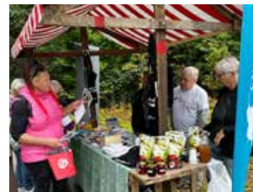
Information och insamling vid lokalföreningens bord på Friskvårdens dag.