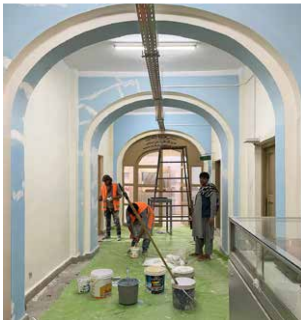
Renovering pågår samtidigt som museet är öppet.

Under årtionden av krig har museet blivit utsatt för skadegörelse flera gånger och många föremål har stulits. Konservatorer har kallats in för att återställa dyrgripar som slagits i spillror. Vissa klenoder har förvarats utomlands eller på säkrare platser i Kabul. Många av landets arkeologiska