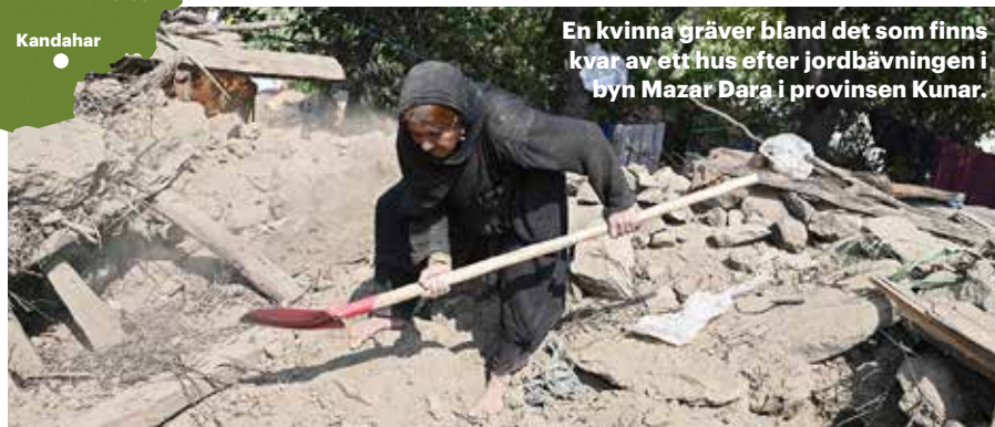
En kvinna gräver bland det som finns kvar av ett hus efter jordbävningen i byn Mazar Dara i provinsen Kunar.