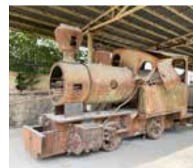
Loket sägs vara en gåva från Sveriges kung Gustav V.