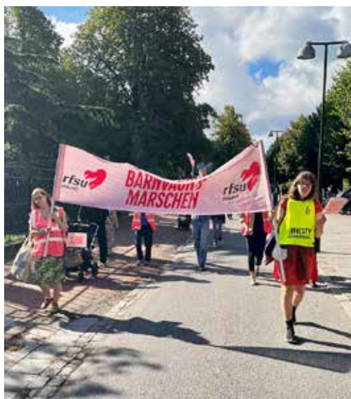
Marsch och föreläsningar uppmärksammade vikten av att agera mot mödradödlighet.