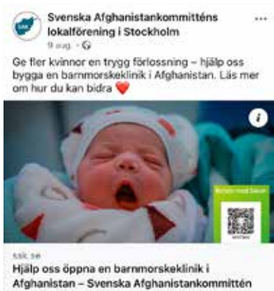
Ett av SAK Stockholms många inlägg om insamlingen.