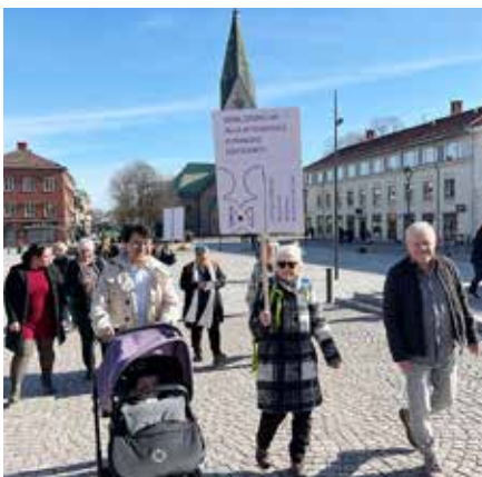
Lokalföreningen i Skövde/Skaraborg uppmärksammade de afghanska kvinnornas rättigheter.

SAKS LOKALFÖRENING I SKÅNE hade tillsammans med Utrikespolitiska föreningen