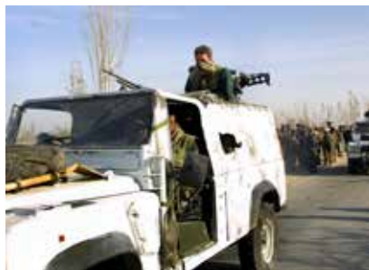
Brittiska specialstyrkor i Mazar-e Sharif i början av kriget.

Vittnesmålen sträcker sig över en tioårsperiod, betydligt längre tid än de tre år som just nu undersöks i en offentlig utredning i Storbritannien.