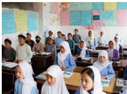
Tack vare svenskt bistånd har flickor under lång tid fått utbildning genom SAK.