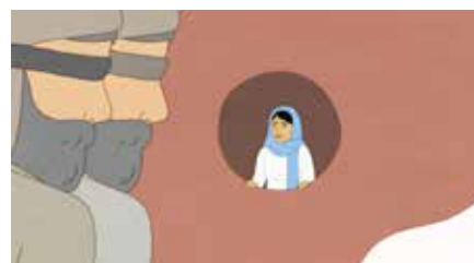
Raha rapporterar från livet i Kabul i ”Hemligheternas Kabul” som kan ses på SVT Play.