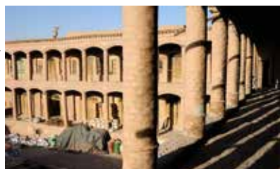
En karavanseraj i Herat.