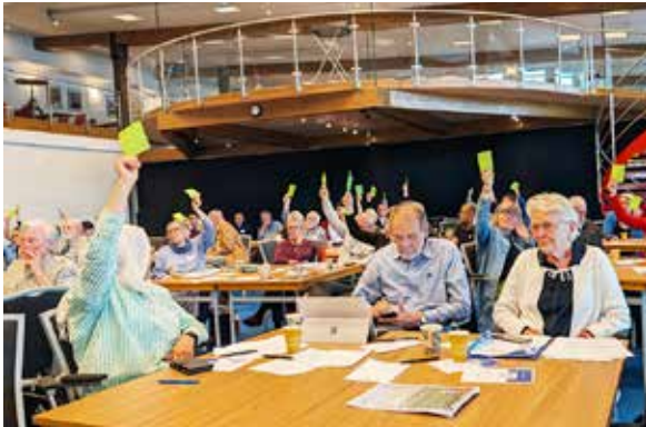
Årsmötet röstade om talibanstyret ska benämnas de facto-styret eller den afghanska regimen i årsmötesut-talandet. Det blev "de facto-styret".