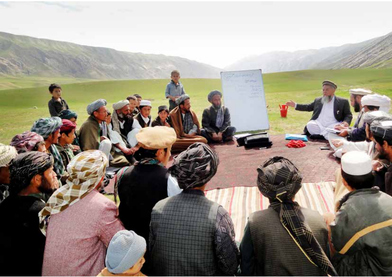
De lokala bytvecklingsråden (CDCs) var en kombination av tradition och nya sedvänjor. Här håller ett bytvecklingsråd möte i byn Qaflani i Samanganprovinsen 2013. Talibanstyret bestämde sommaren 2024 att byråden skulle upplösas.

bildats under de senaste två decennierna, men att göra det på ett sätt som främjar långsiktig förändring och samtidigt i största möjliga mån minskar risken för bakslag. Vi behöver sträva efter att stödja informella nätverk och utrymmen där kvinnor och flickor kan mötas.