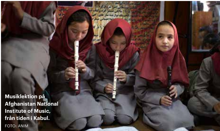
Musiklektion på Afghanistan National Institute of Music, från tiden i Kabul.