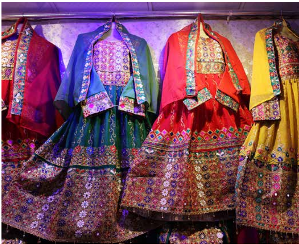
Afghanska kläder är färgglada och dekorerade med broderier och till exempel spegelbitar och pärlor.