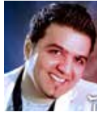
Bjuder på afghanska rytmer.