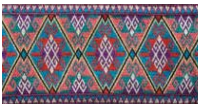
Hazariska kläder smyckas med färgglada broderier. Bilder från utställningen Afghan Dress , Textile Research Centre, Leiden.