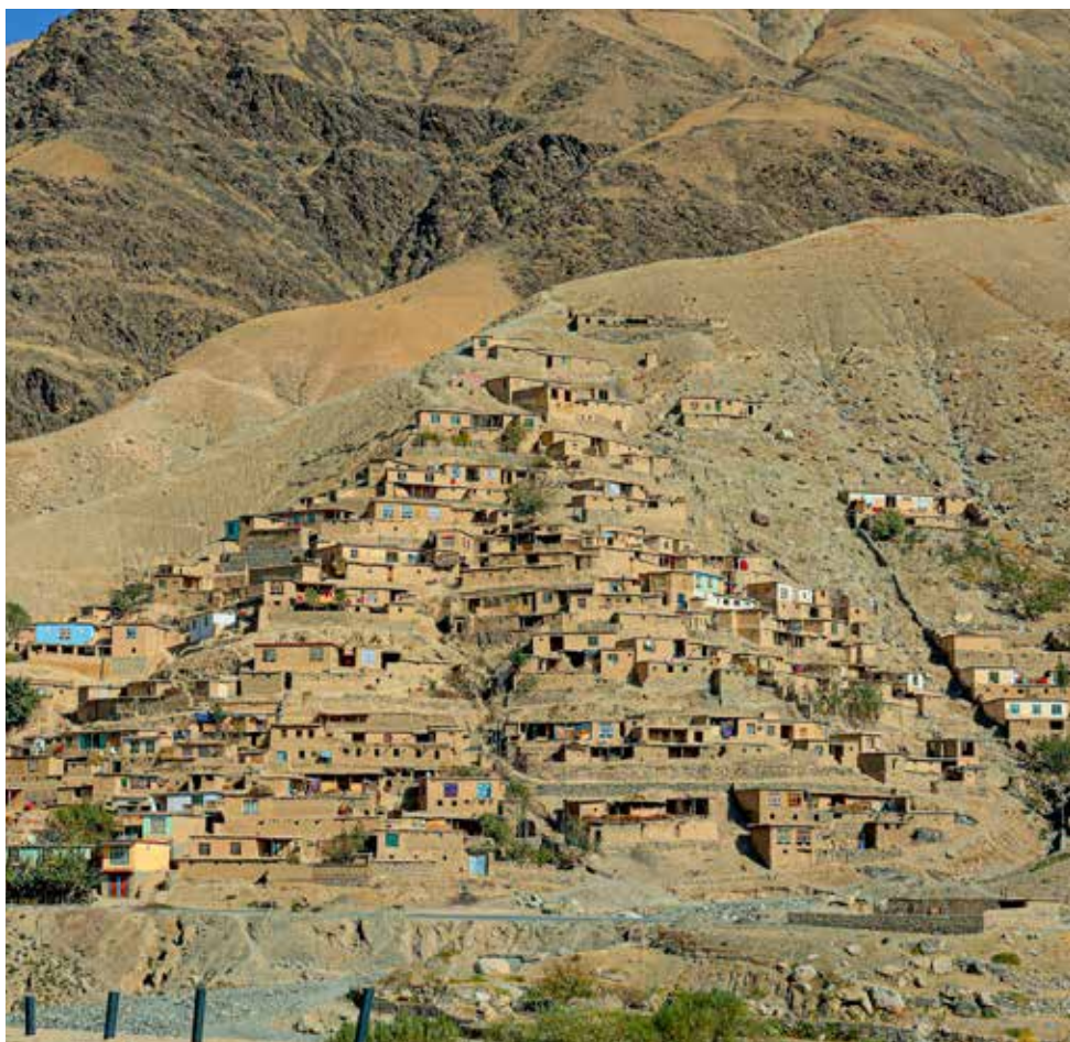
Byarna byggs ofta i sluttningar i provinsen Badakhshan, vilket gör dem särskilt sårbara för jordskred.