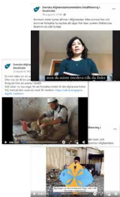
Keramik, diktläsning och en vacker drake visas i några av Stockholms lokalförenings filmer.