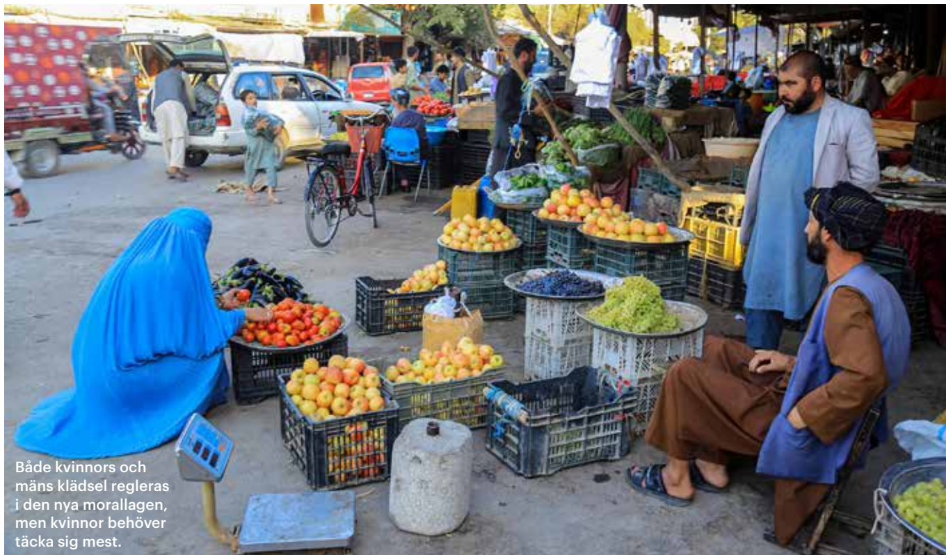
Både kvinnors och mäns klädsel regleras i den nya morallagen, men kvinnor behöver täcka sig mest.