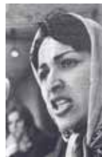
Meena Keshwar Kamal.

Meena Keshwar Kamal föddes i en medelklassfamilj i Kabul 1956. Hon reagerade tidigt på orättvisan i att kvinnors liv var så beskurat och ofritt. Trots hennes fars despotiska behandling av familjen uppmuntrade han ändå sin dotter att studera på universitet, och hon startade som 20-åring Revolutionary Association of the Women of Afghanistan (RAWA).