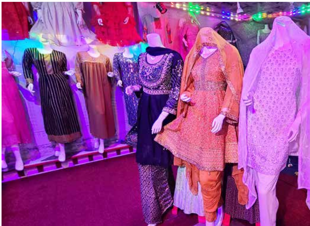
Så kallade panjabi och maxi-klänningar i en butik i Ghazni, korta klänningar med byxor under.

➤➤ att täcka kroppen. Ansiktet lämnades fritt. I Iran bar kvinnor historiskt denna typ av klädsel med en separat slöja för ansiktet. I Pakistan och norra Indien slog man samman dessa till ett enda klädesplagg, men med hål för ögonen. Det var den ursprungliga burkan.