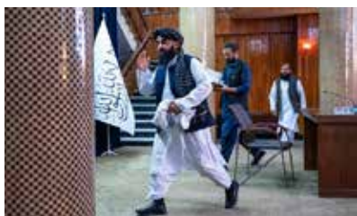
Zabihullah Mujahid på en presskonferens i Kabul efter Doha-mötet. Han sade att mötet var framgångsrikt.

I somras deltog för första gången representanter för de facto-styret på det FN-ledda internationella mötet om Afghanistan i Qatar, det tredje så kallade Doha-mötet. FN:s undergeneralsekreterare Rosemary DiCarlo beskrev det som en viktig möjlighet för omfattande engagemang från alla parter för att förbättra den humanitära situationen. Mötet kritiserades för att där inte fanns representanter för afghanska kvinnor och civilsamhället, vilka i stället träffade Rosemary DiCarlo på ett sidomöte. Zabihullah Mujahid som ledde talibanernas delegation beskrev mötet som positivt för Afghanistan.