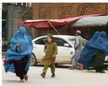
För det afghanska folkets skull är dialog med talibanregimen nödvändig.