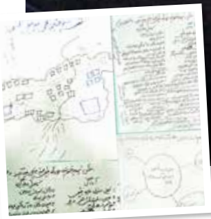
Norska Afghanistankommittén genomför utbildning med en lokal kommitté för krishantering och katastrof-förebyggande, CDMC. Till vänster: Kartläggning av högriskzoner.