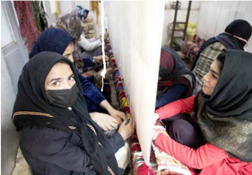
Kvinnliga väverskor har gått samman i The Herat Carpet Weaving Women's Association. Här träffas de på UNDP:s marknadsdagar för endast kvinnor, till stöd för kvinnligt företagande.