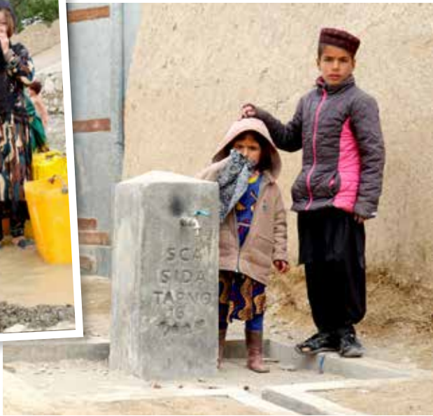
EFTER: Nu kan barnen ta vatten från kranar utanför huset.