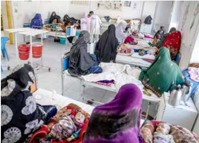
Varje säng delas av två mödrar med varsitt barn på avdelningen för undernärda barn på sjukhuset i Lashkar Gah i provinsen Helmand. Boost-sjukhuset stöds av Läkare utan gränser.