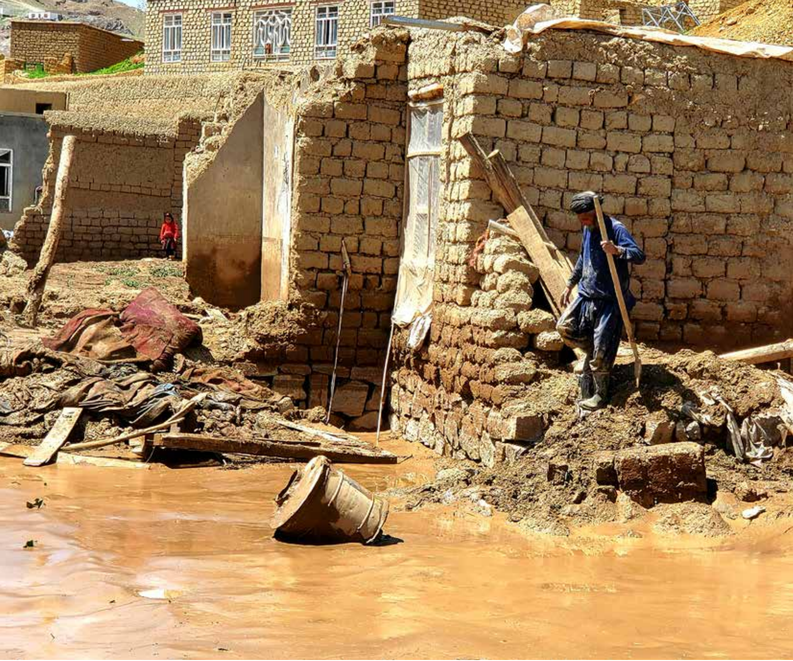
En man samlar ihop sina ägodelar i sitt skadade hem i provinsen Ghor. Hundratals människor dog i översvämnningar i flera provinser i Afghanistan i maj.

svämning och torka skulle integrera en rad infrastrukturprojekt och småskaliga insatser. Att genomföra större projekt är inte möjligt just nu på grund av de större givarnas beslut att inte samarbeta med talibanstyret. Däremot kan insatser i mindre skala genomföras inom ramen för pågående humanitära program eller ”cash-for-work”.