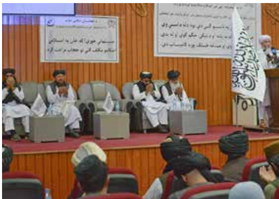
Den talibanledda Högsta domstolen i Afghanistan.