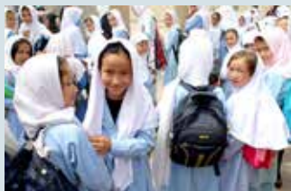
Elever på en av SAKs skolor.

11 JULI 2023 Talibanernas högsta ledare meddelar genom en talesperson på X att "alla Sveriges aktiviteter" i landet ska