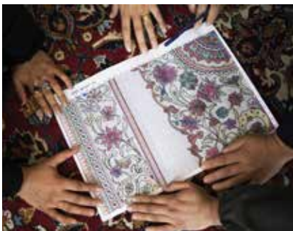
Samarbete kring mattvävning i Herat.