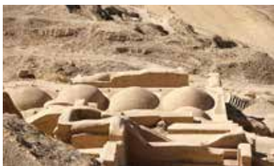
Shahr-e Gholghola, eller "Skrakens stads" ruiner i Bamiyan.