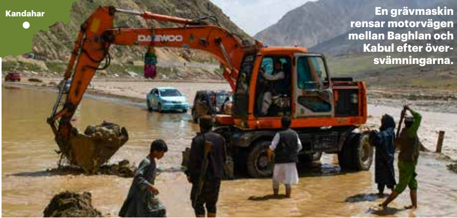
En grävmaskin rensar motorvägen mellan Baghlan och Kabul efter översvämningarna.