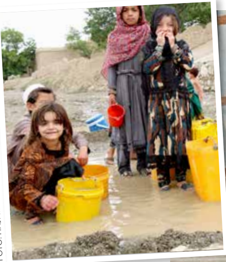
FÖRE: Barn i byn Yousaf Khail hämtar vatten från flodbädden, augusti 2022.