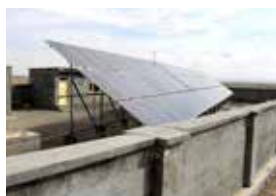
Brunnens vattenpump drivs av 90 solpaneler.

BYBORNA HADE försökt gräva brunnar, men vattnet var salt. När SAK inledde vat-