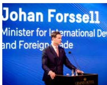
Biståndsminister Johan Forssell.