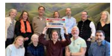
SAKs kansli firar stödet på 17 miljoner.