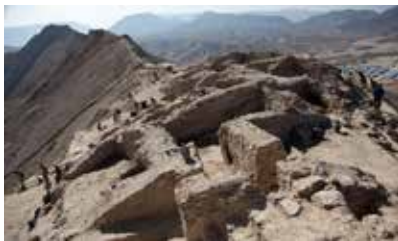
Mes Aynak, en av landets tiotusentals arkeologiska platser.

Analysen är en del av ett USA-finansierat projekt för att identifiera arkeologiska platser i Afghanistan. När det påbörjades 2015 hade 5 000 platser dokumenterats, inklusive 2 500 år gamla boplatser. Tillsammans med afghanska arkeologer skapade teamet från UC en databas med satellitbilder. Med hjälp av AI hade över 29 000 arkeologiska platser identifierats 2021.