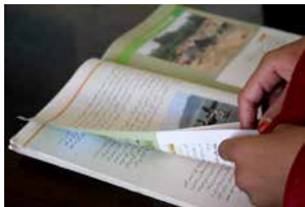
En lärobok i samhällskunskap. När läroplanen görs om handlar det till stor del om nya textböcker.

– Den här gången vet människor om att det finns alternativ, och många flickor och unga kvinnor är fast beslutna om att läsa vidare efter årskurs 6. Vi talar exempelvis om hemundervisning och onlinekurser,