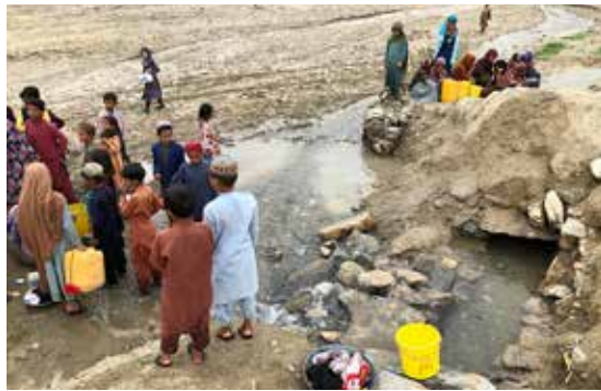
Byns enda vattenkälla, i provinsen Paktika. Utvecklingen i Afghanistan har stannat av.