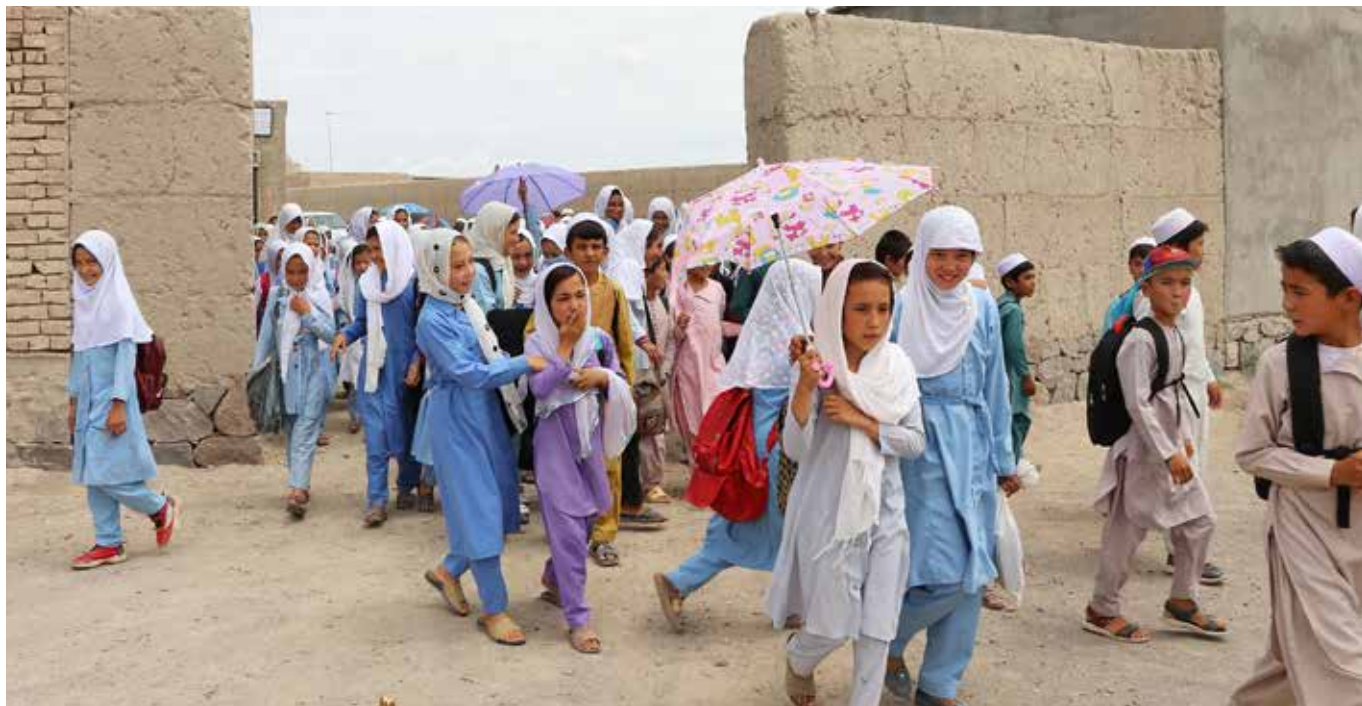
Elever på Nawabad-skolan i Ghazni. Under året kommer SAKs skolor att lämnas över till lokala myndigheter.