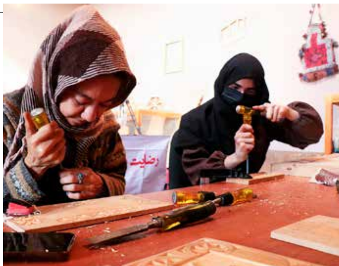
Kvinnor lär sig gravyrteknik i en verkstad i Herat.

GUANTÁNAMO Två afghaner som suttit fängslade i Guantánamo i 14 år och därefter i husarrest i Oman i sju år släpptes fria i februari och har återvänt till Afghanistan. En afghansk fånge finns kvar i Guantánamolägre i Kuba.