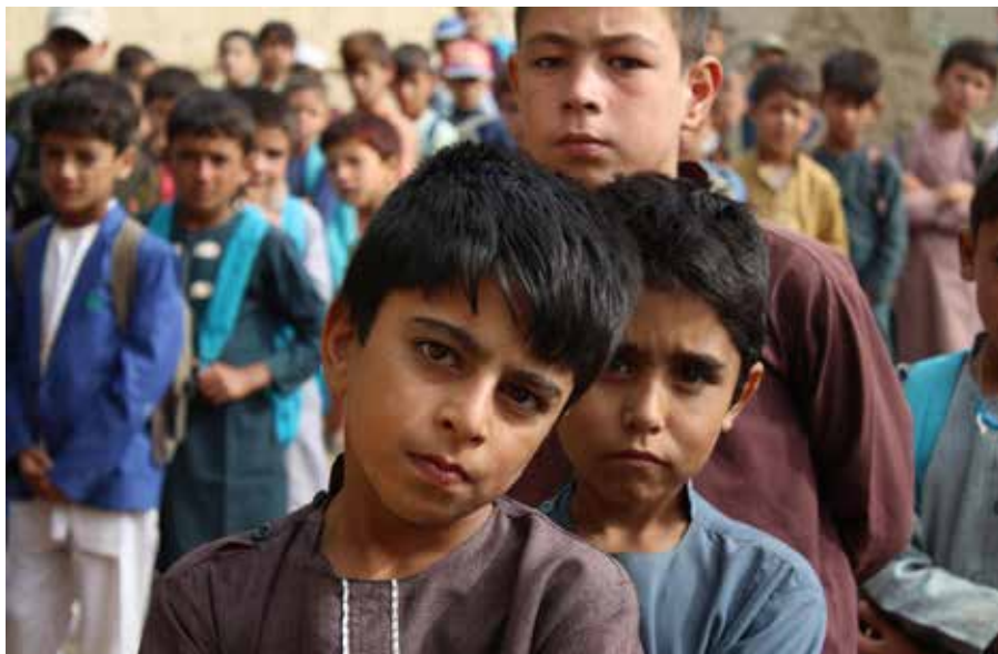
Pojkar väntar på att skoldagen ska börja i en skola i Ghazni.