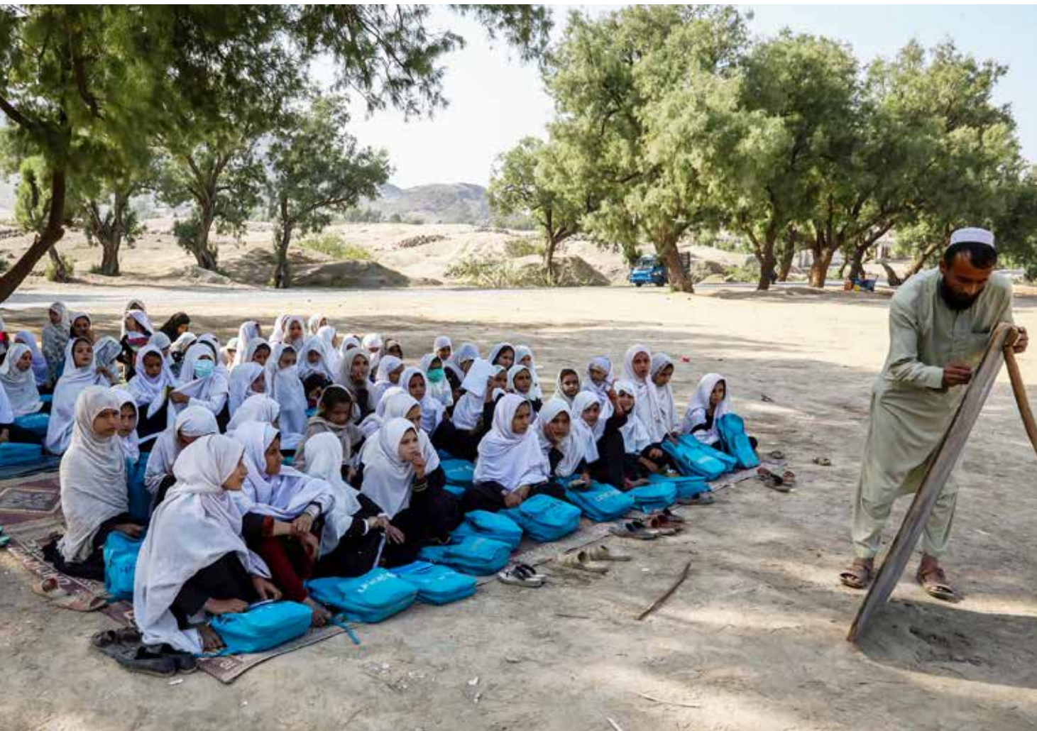
Barnen på Mangal-grundskolan, med 415 pojkar och 348 flickor, har tvingats få undervisning utomhus under 13 år. Varken det förra eller det nuvarande styret har hörsammat föräldrarnas krav på att se till att barnen får rimliga förutsättningar till undervisning.