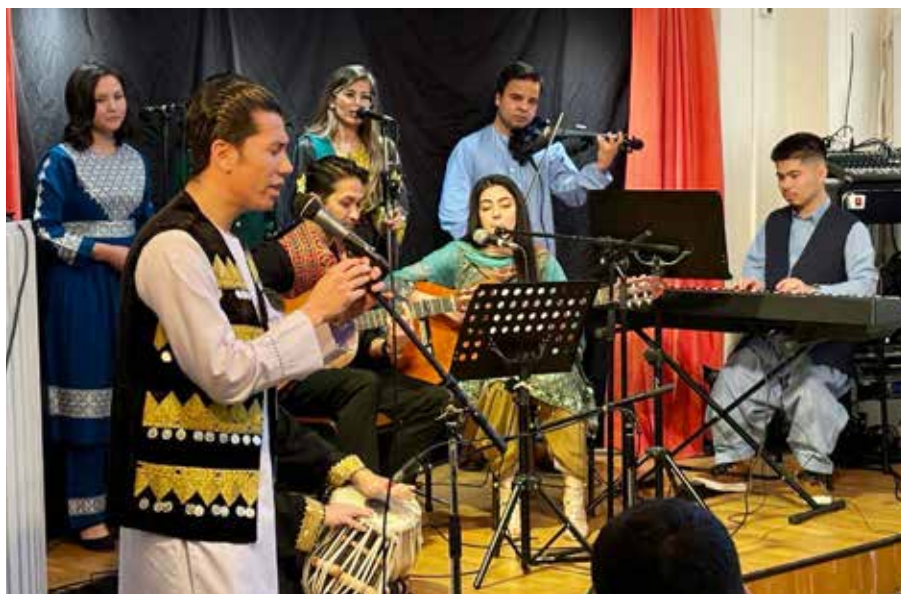
Sång och musik med gruppen Projekt +93.