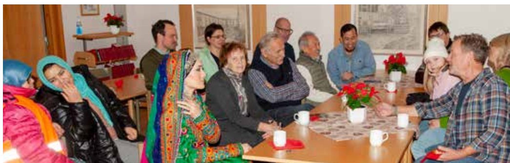
Fika och samtal om situationen i Afghanistan med aktiva i SAKs lokalförening i Dalarna.

SAKs nystartade lokalförening i DALARNA har inlett en turné för att visa att den finns och för att hålla engagemanget för Afghanistan vid liv. Turnén kallas "Fika för Afghanistan". I december hölls den första träffen i Ludvika, där omkring 15 personer samlades.