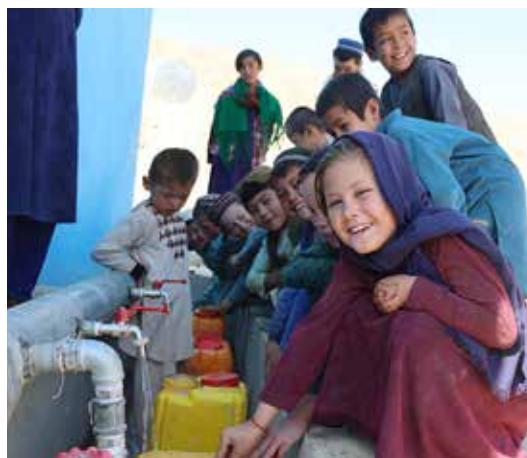
Rent vatten har kommit till byn Terman Sai. Barnen kan gå i skolan och slipper bli sjuka av smutsigt vatten.

– Användandet av förorenat och smutsigt vatten är en vanlig orsak till sjukdomar bland både barn och vuxna. Bristen