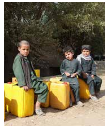
Barnen i byn Omar Khil måste gå långa sträckor för att hämta vatten i en smutsig flod.