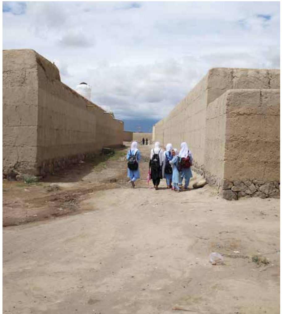
Talibanerna har bestämt att alla skolor ska nationaliseras. Av de cirka 6–8 miljoner barn som går i skolan i Afghanistan uppskattas omkring 600 000 elever gå i skolor som drivs av internationella organisationer.

– Vi vet att det har skickats delegationer till Kandahar, och man har uppvaktat