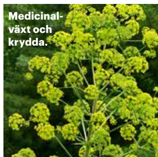
Medicinalväxt och krydda.

EKONOMI Lokala myndigheter i Panjshir har utfärdat 200 licenser för utvinning av smaragder, och ytterligare 300 licenser kommer snart att utfärdas. Enligt det lokala styret finns det 750 smaragdgruvor i provinsen.