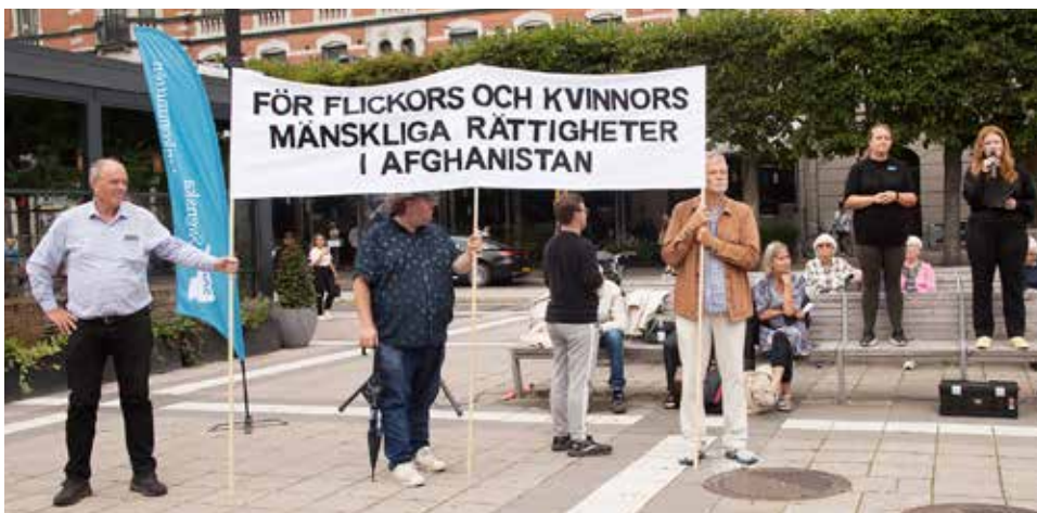
Omkring 200 personer slöt upp på manifestationen på Norrmalmstorg för afghanska flickors och kvinnors rättigheter.