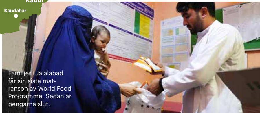
Familjer i Jalalabad får sin sista mat-ranson av World Food Programme. Sedan är pengarna slut.