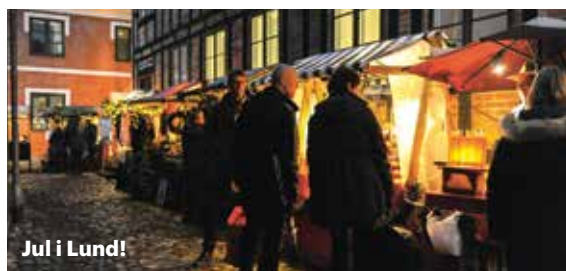
Jul i Lund!