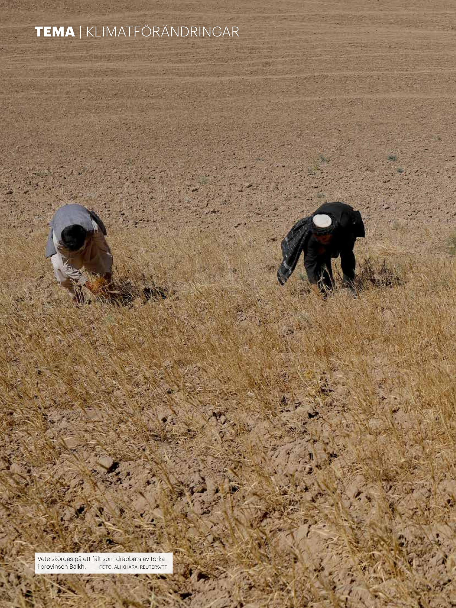
Vete skördas på ett fält som drabbats av torka i provinsen Balkh.