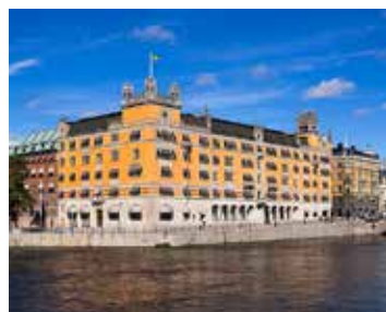
Regeringen ser över biståndet.