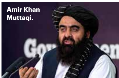
Amir Khan Muttaqi.