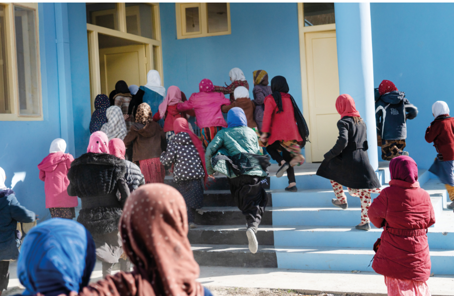
Full fart in till lektionen i en av SAKs skolor i byn Yrskin.

Det bästa sättet att stödja civilbefolkningen i Afghanistan är att bli månadsgivare. Allt stöd är lika viktigt, men som månadsgivare är just regelbundenheten i sig en särskild kvalitet. Som månadsgivare ger du mer stabilitet och långsiktighet samt hjälper till att minska de administrativa kostnaderna vilket ger mer pengar till vår verksamhet i Afghanistan.