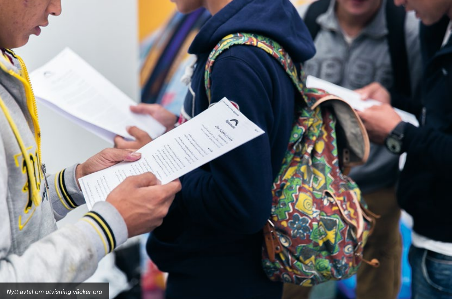
Nytt avtal om utvisning väcker oro