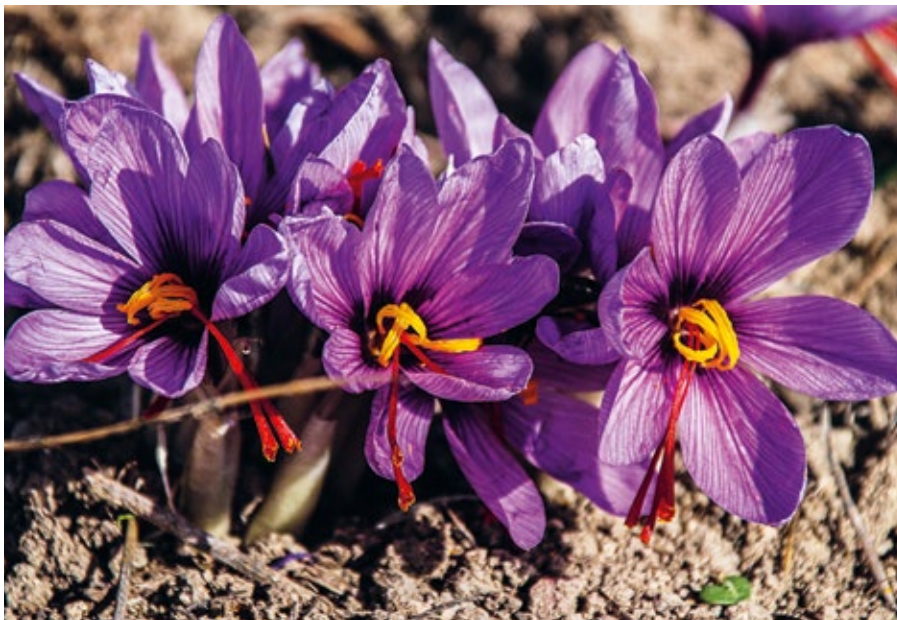
Saffran kommer från gula "märken" i saffranskrokus och är den dyrbaraste av alla kryddor.