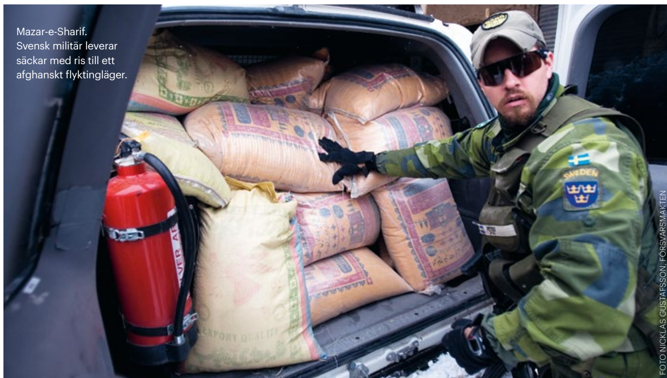
Mazar-e-Sharif. Svensk militär leverar säckar med ris till ett afghanskt flyktingläger.