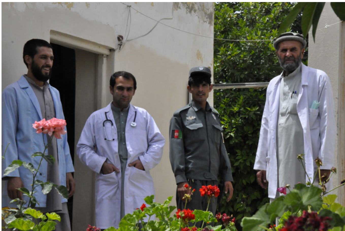
▲ Hela personalstyrkan på den lilla fängelsekliniken, och en kriminalvårdare.

kan består av en läkare, en sjuksköterska och Sidalam som assistent. Fängelset fungerar även som häkte för intagna som ännu inte fått någon dom, ett vanligt fenomen i många utvecklingsländer.