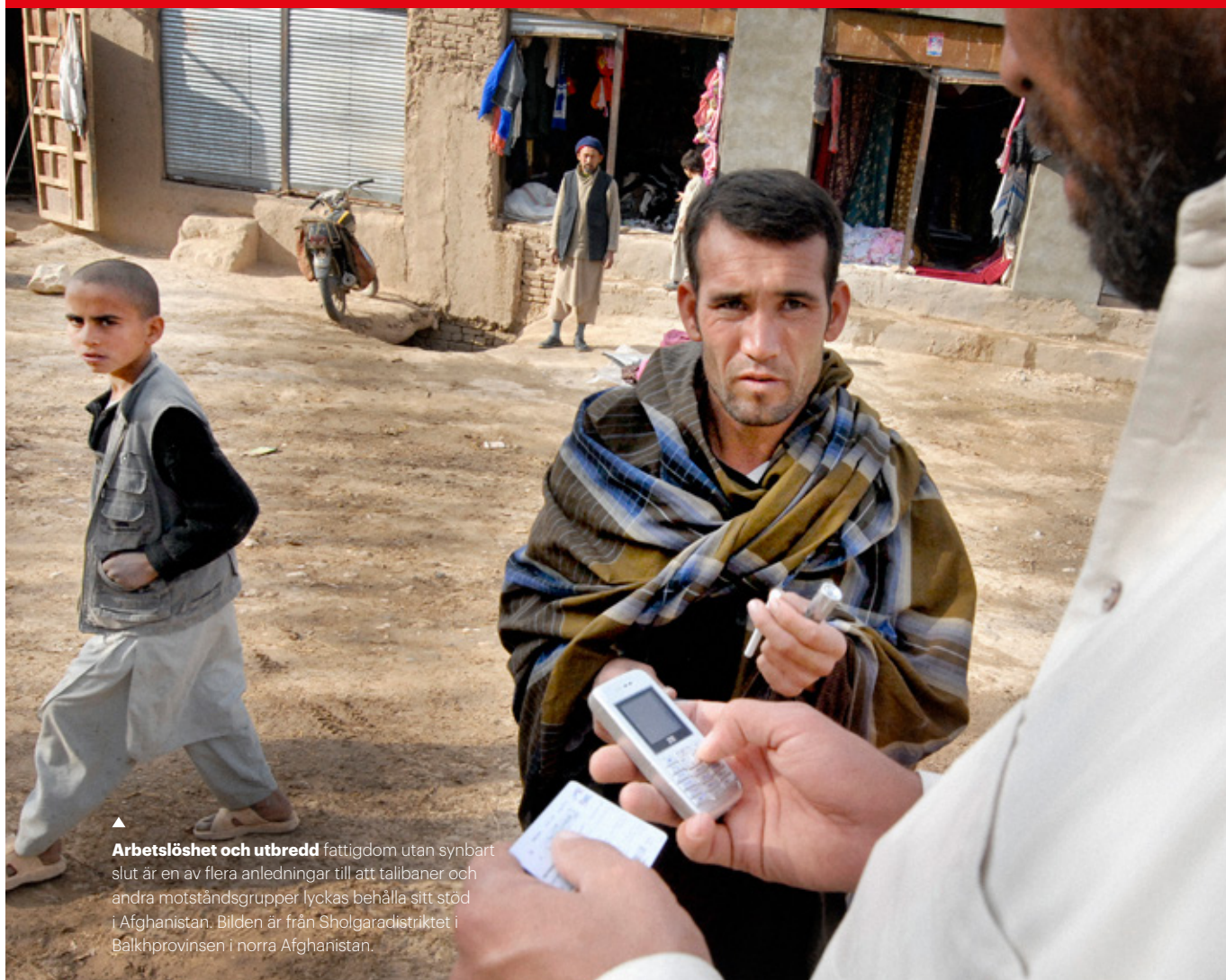
▲ Arbetslöshet och utbredd fattigdom utan synbart slut är en av flera anledningar till att talibaner och andra motståndsgupper lyckas behålla sitt stöd i Afghanistan. Bilden är från Sholgaradistriktet i Balkhprovinzen i norra Afghanistan.