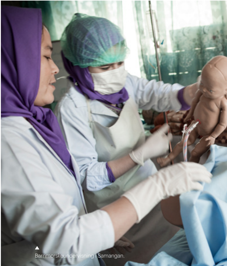
▲ Barnmorskeundervisning i Samangan.