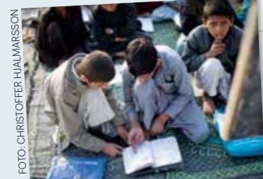
Musikhjälpens tema var barns rätt att gå i skola även i krigsområden.