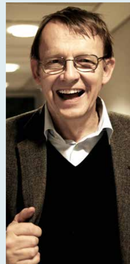
Hans Rosling blev 68 år.

”SAK förenar pragmatism med ett orubbligt långsiktigt mål, samt sätter framför allt målet för verksamheten i Afghanistan framför målet att gynna egen organisations rykte och berömmelse.”