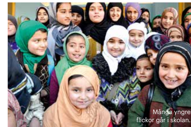
Många yngre flickor går i skolan.