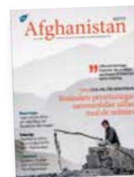
Afghanistan-nytt nr 3 2016.

KONTAKT | Svenska Afghanistankommittén Malmgårdsvägen 63, 116 38 Stockholm Tel 08-545 818 40, Fax 08-545 818 55 info@sak.se, www.sak.se Afghanistan-nytt stöds med bidrag från Sida. Sida delar inte nödvändigtvis de åsikter som framförs. SAK ansvarar för innehållet.