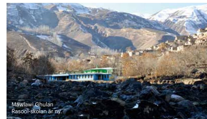
Mawlawi Ghulan Rasool-skolan är ny.