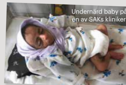
Undernärd baby på en av SAKS kliniker.

KÄLLOR: UNOCHA, THE LANCET, AFGHANISTANS HÄLSOVÅRDSDEPARTEMENT. Med reservation för att statistik i Afghanistan sällan är helt tillförlitlig.