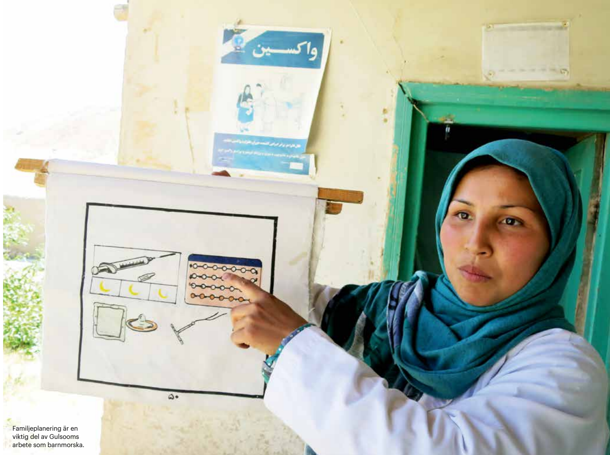
Familjeplanering är en viktig del av Gulsooms arbete som barnmorska.

– Tidigare sa några till mig att jag inte