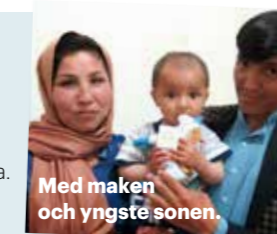
Med maken och yngste sonen.

Tvåårig barnmorskeutbildning genom SAK i Aybak i Samanganprovinsen.