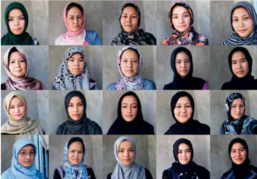
Fotograferna till utställningen People That Matter.